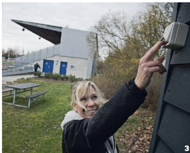
Glostrup Idrætsanlæg Glostrup Idrætsanlæg omfatter Glostrup Fritidscenter, Glostrup Idrætspark samt Hvisingehallen.